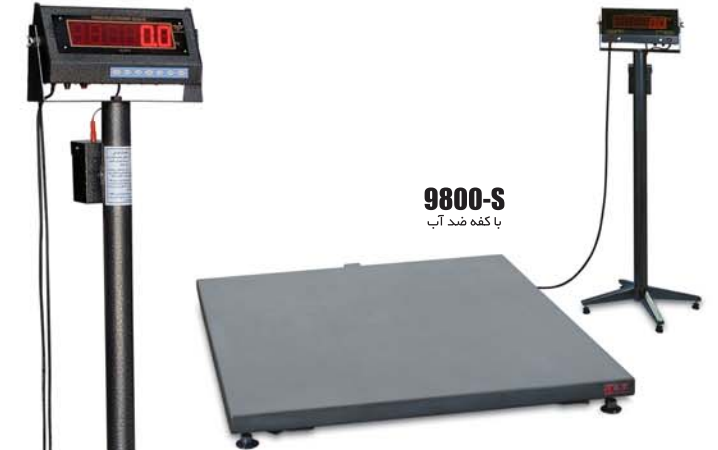
9800-S با کفه ضد آب